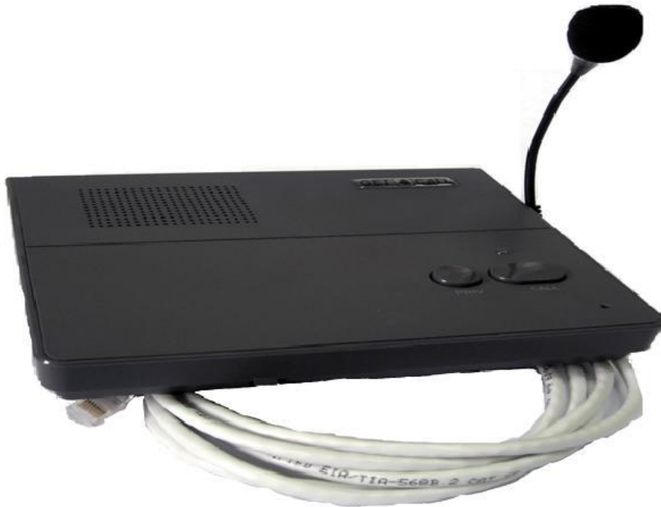
Рисунок 1- Внешний вид пульта GC-4001DG

Питание пульта постоянным напряжением 12В обеспечивается от внешнего блока питания (адаптера), входящего в комплект.